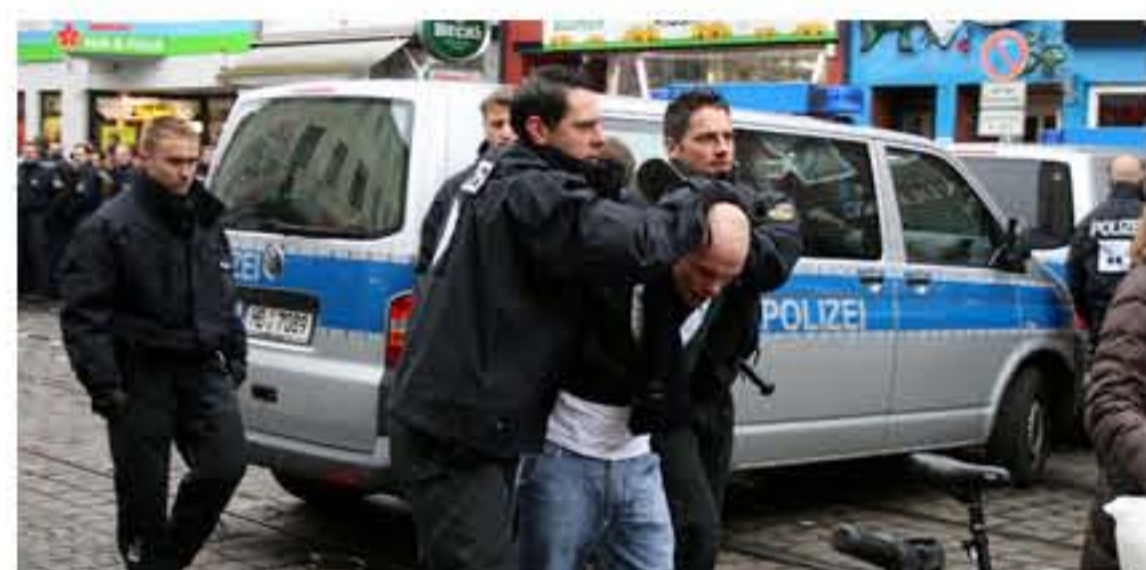
Schon vor dem Spiel WerderBremen gegen Eintracht ging die Polizei massiv gegen die Frankfurter Fans vor.

Die Bremer Polizei muss sich nach ihrem Einsatz beim Bundesligaspiel am Wochenende massive Kritik anhören. Sie hatte für vier Strafanzeigen 234 Fans stundenlang präventiv in Gewahrsam genommen, offenbar unter miserablen Haftbedingungen. VON JAH ZIER